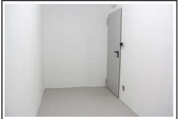
Interior de la entidad