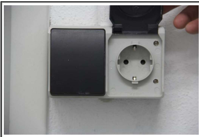
Enchufe e interruptor (interior sub-entidad)