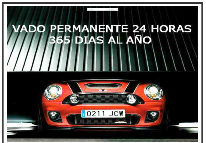
Zona interior de carga y descarga para vehículos