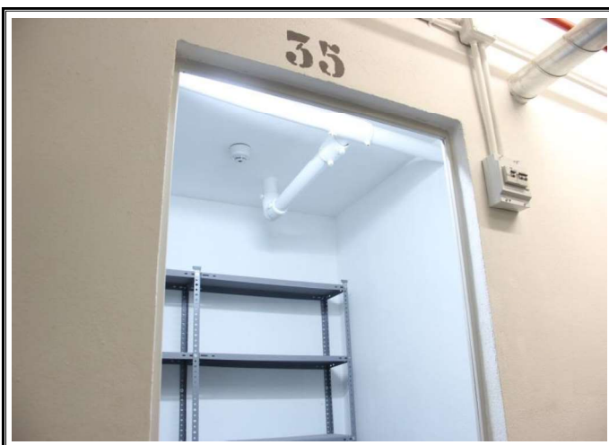
Vista exterior sub-entidad y medidor de luz independiente